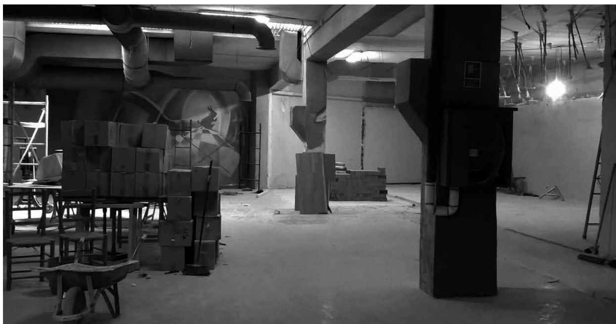
Tras las obras, la sede de Peñuelas contará con un amplio salón de actos.

rial que abordaremos en el siguiente número del Bicel . Por el momento, como en el dicho popular que dice «cuando el dedo señala a la luna, el tonto mira al dedo», la Democracia ejerce de dedo político que apunta a la luna emancipadora para atrapar a los incautos votantes.