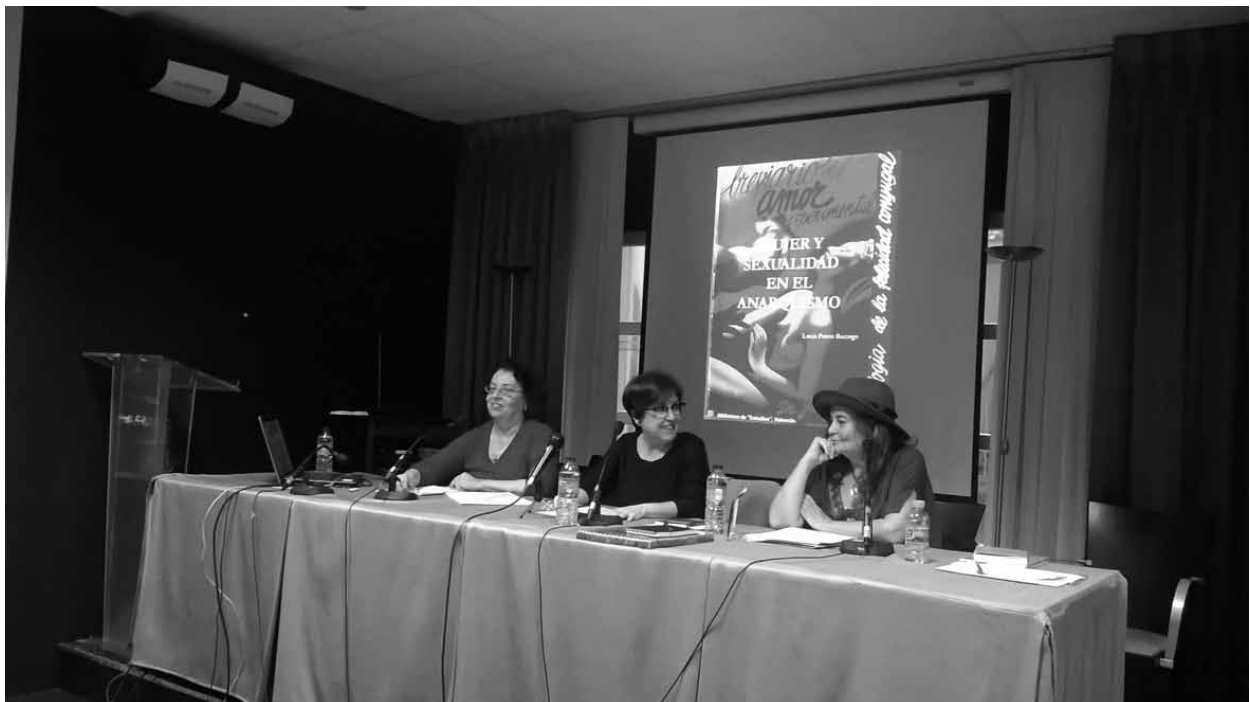
Mesa "Las propuestas de Mujeres Libres para conseguir la igualdad de género" - Fotografía: Sonia Lojo.

que militaban. Tal fue el caso de la Asociación de Mujeres Antifascista (AMA) que, atendiendo a las directrices del partido del que dependían, el PCE, negaba la necesidad de hacer la revolución social que anarquistas y poumistas defendían y otorgaba a la mujer el papel de puro instrumento de la situación de guerra en la que se vivía. Fueron muchas las diferencias entre ambos sectores que se hicieron insostenibles tras