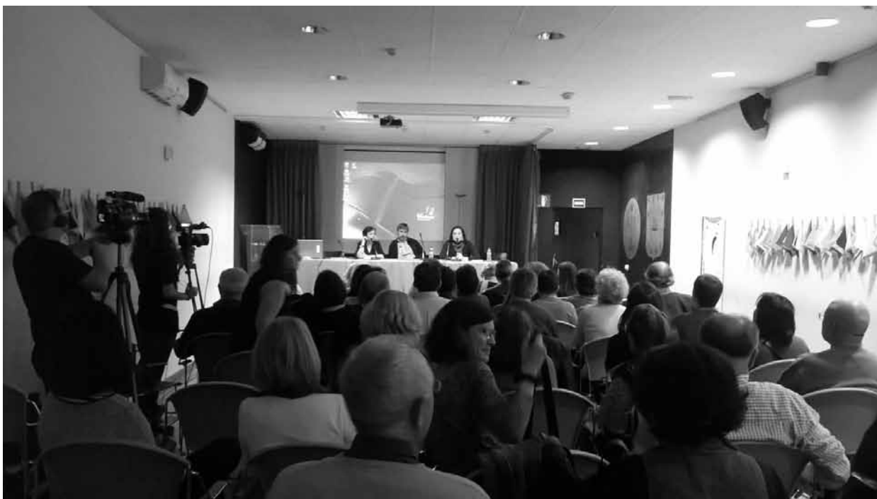
Las jornadas despertaron el interés de numeroso público.

vía nos encontramos con la triste realidad de ser las cuidadoras en el ámbito familiar y no disponer del derecho a una maternidad responsable. Destacó cómo el surgimiento de Mujeres Libres fue la consecuencia de aquellas pioneras que desde finales del siglo XIX habían luchado por los derechos de las mujeres, como Teresa Mañé, que además fue la primera mujer en España que dirigió una revista. Reconoce a Mujeres Libres como