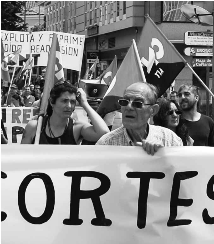
Padín se implicó activamente en el sindicato hasta el final.

La Plataforma contra los Crímenes del Franquismo insta al Ayuntamiento de Miranda a personarse en la querrela argentina que el sindicalista defendió en sus últimos años de vida.