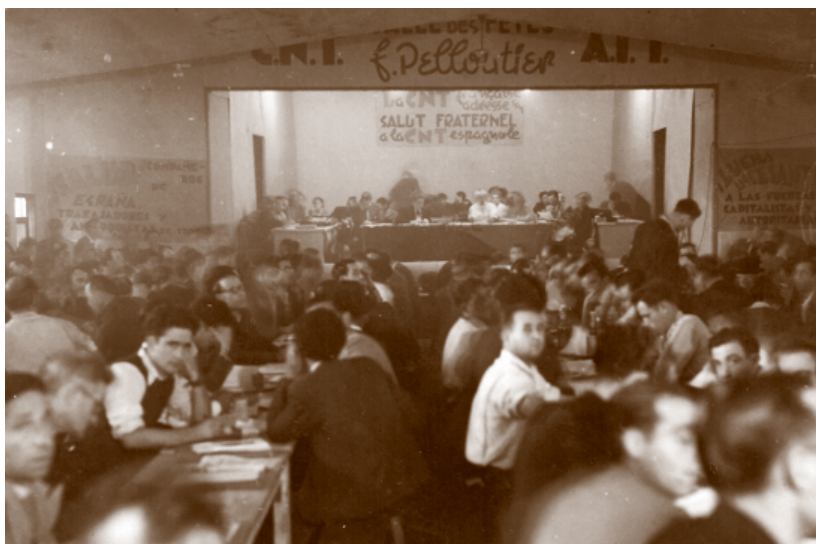
1961-Pleno 2º congreso MLE-CNT en Francia Toulouse 1947