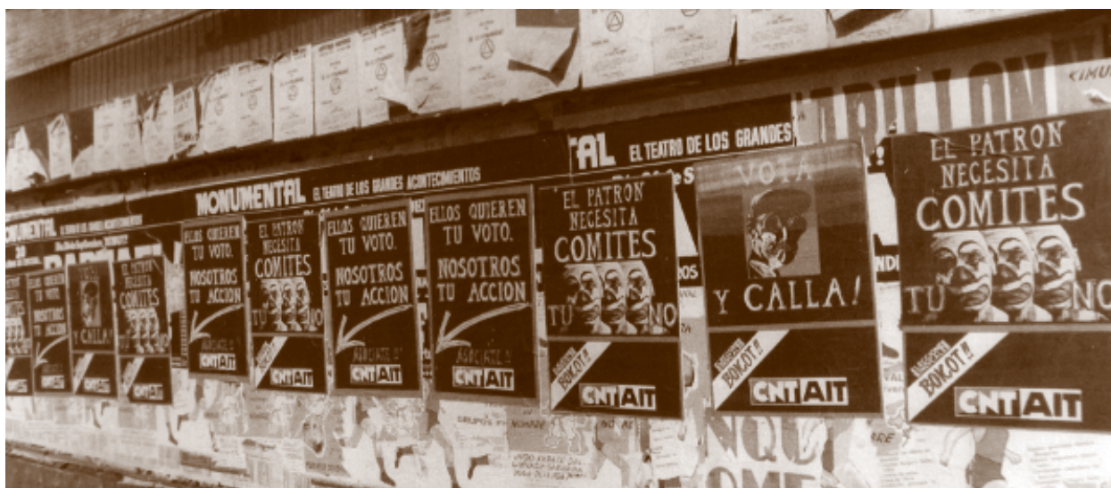
1978-Elecciones Sindicales 1980